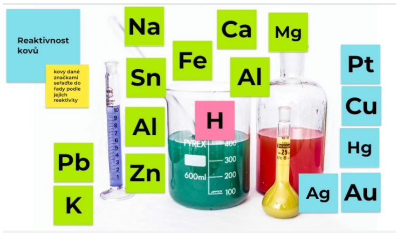
Obrázek 1: Ukázka Jamboardu: Beketovova řada

na čtverečkový papír. Pokud žáci použijí vlastní chytrý telefon, není třeba specializovaná učebna. Pro mentální mapy a složitější postupy se lépe hodí Jamboard, kromě propojování konkrétních lístečků lze využít kreslení šipek a souvislostních čar. Samozřejmě lze použít i specializované aplikace jako: (18).